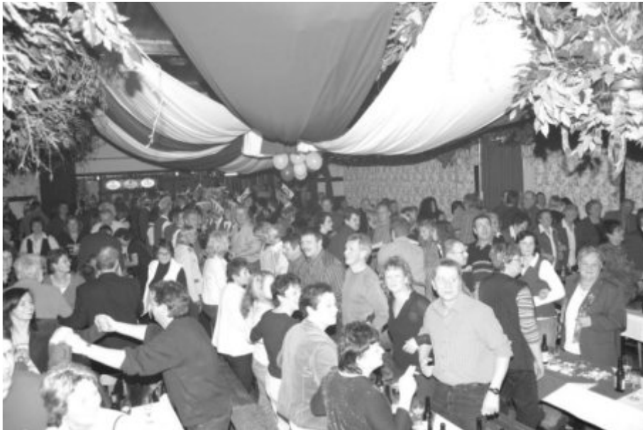
Ein voll besetzter Saal in guter Stimmung

Im Tecklenburger Land, da liegt ein Örtchen Das spricht im Karneval auch noch ein Wörtchen, fragst Du nach jenem Ort, dann hör genau, das ist der Dickenberg, Helau, Helau, Helau.