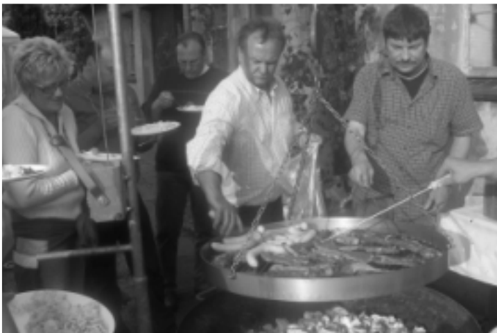
Fleißige Helfer bei der Arbeit

Eine große Leinwand ist vom Festausschuß aufgebaut worden, damit alle Fußballinteressierten den letzten Bundesligaspieltag verfolgen konnten. Die Kinder freuten sich über die vorbereiteten Spiele und so verging die Zeit, bis der Grill angeheizt werden konnte, wie im Fluge. Bei der anschließenden Tombola verlor man viele schöne und wertvolle Preise. Danach wurde bis spät in die Nacht getanzt und gefeiert.