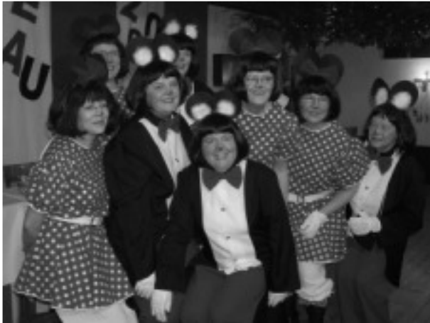
"Der Elferrat der Weiberfastnacht"

Ganze Gruppen kleiden sich gemeinsam an und entsprechend ist auch die Stimmung. Sie machen jedes Jahr den Weiberkarneval zu dem, was er jetzt ist!