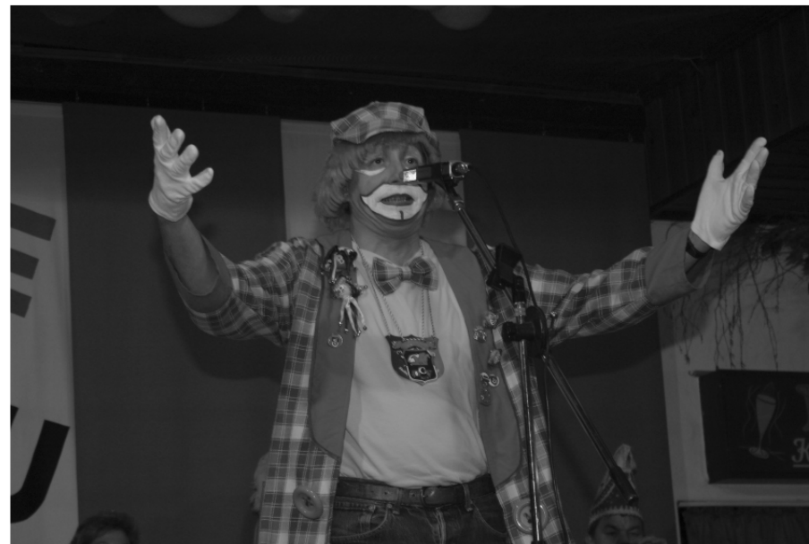
Andreas bei einem seiner zahlreichen Auftritte

Andreas: Brauchen? Nein, brauchen nicht, es macht Spaß. Wenn es mir keinen Spaß mehr macht, würde ich ganz schnell damit aufhören