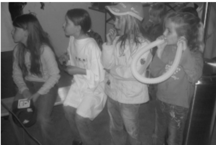
Die Kinder verfolgen gespannt die Tombola

Eine große Leinwand ist vom Festausschuß aufgebaut worden, damit alle Fußballinteressierten den letzten Bundesligaspieltag verfolgen konnten. Die Kinder freuten sich über die vorbereiteten Spiele und so verging die Zeit, bis der Grill angeheizt werden konnte, wie im Fluge. Bei der anschließenden Tombola verlor man viele schöne und wertvolle Preise. Danach wurde bis spät in die Nacht getanzt und gefeiert.