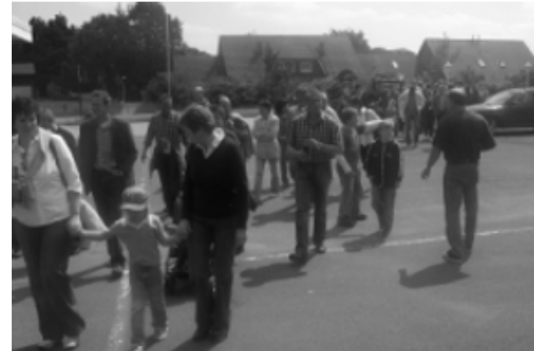
Abmarsch bei Antrup

auch ausserhalb der 5. Jahreszeit ist die Karnevalsgemeinschaft aktiv!