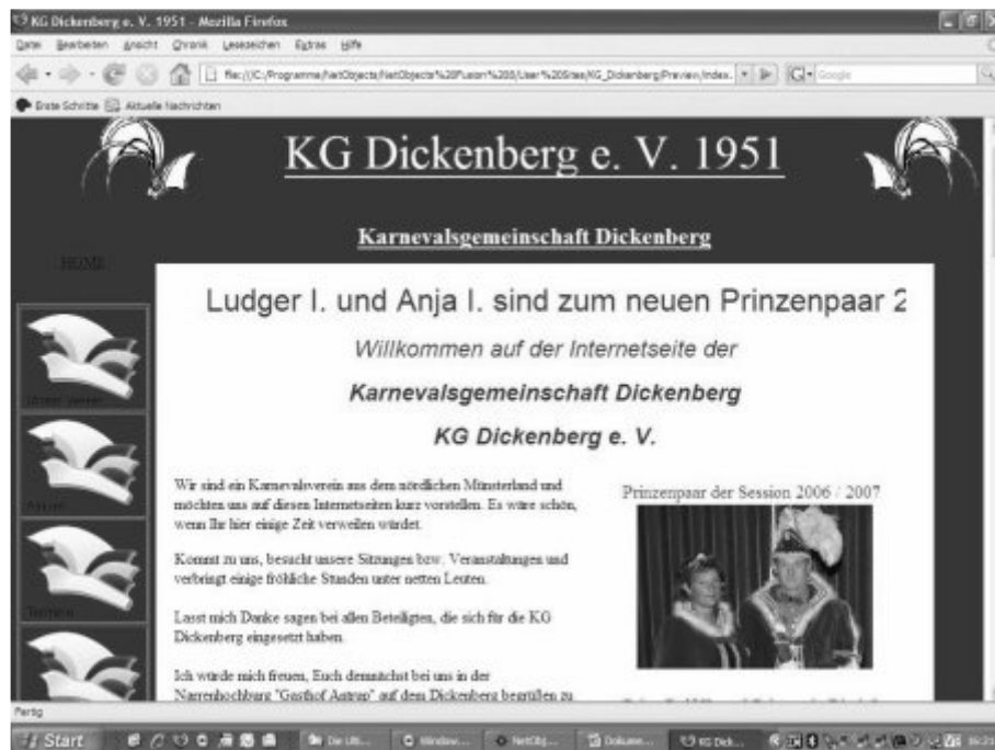
So präsentiert sich die KG Dickenberg im Internet

Endlich ist es soweit. Seit Oktober 2007 ist unser Karnevalsverein auch im Internet vertreten. Ganz im Outfit unserer Vereinsfarben rot/weiß präsentiert sich unsere Internetseite. Hier findet Ihr alles rund um den Verein, z.B.: Termine, Aktuelles, Chronik, Satzung, Fotogalerie, sowie eine Prinzenchronik. Außerdem kann man hier Online die Mitgliedschaft beantragen. Falls Ihr noch Anregungen oder auch eine interessante Story für diese Seite habt, so schickt eine E-Mail an: info@kg-dickenberg.de .