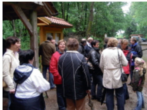
Pause an der Wanderschutzhütte Steinbeck

Der Maigang ist schon seit Bestehen der Karnevalsgemeinschaft ein fester Bestandteil im Veranstaltungsjahr. So wurde auch diese Tradition in diesem Jahr weitergeführt.