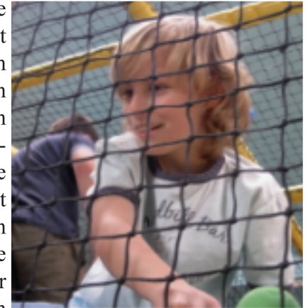
Kinder hinter Gitter?

▪Es war wieder soweit, alle Kinder die sich am letzten Kinderkarneval beteiligt hatten, wurden vom Vorstand zum Kinderfest eingeladen. Wir verbrachten mit den Kindern einen tollen Nachmittag in der Spielhalle „Robby-Robbe“ am Herthasee. Hier konnte nach Herzenslust gespielt und getobt werden. Für das leibliche Wohl waren reichlich Kuchen und Getränke vorhanden. Die Kinder kletterten über die Spielgeräte, sprangen auf den Trampolinen,▶▶