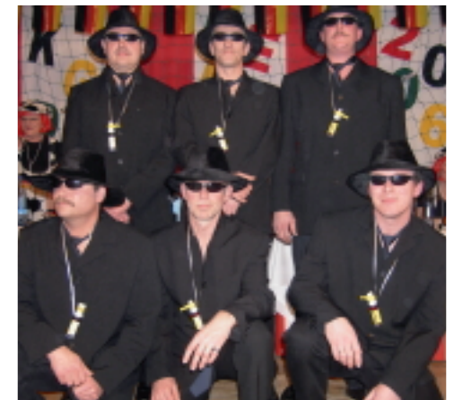
Männerballett "Six black Panthers"

und wichtige Selbstverteidigungstechniken. Auch Kinder-tanzen biete ich an, und ich hoffe, bei den Mädchen die dann dort tanzen, Nachwuchs für die Karnevalstanzgruppen zu finden. In meinen eigenen Räumen bin ich nun in der Lage mit den Tanzmädchen jederzeit zu trainieren. Ich hoffe, dass mir neben meiner Arbeit genug Zeit bleibt die Tanzgruppe weiter zu führen, und dass in diesem Jahr die Mädchen dabei bleiben, obwohl sie schulisch sehr gefordert sind.◆