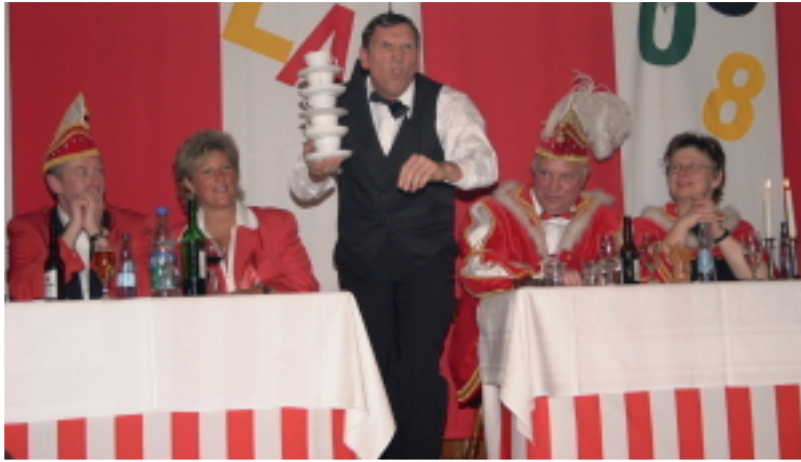
Wo kann man so ein Gesicht kaufen ????