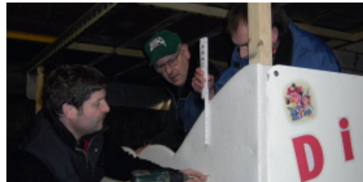
Die Männer zimmern den Wagen zurecht

Zum Abschluss trafen sich dann alle Narren im Vereinslokal Antrup, wo man fröhlich und ausgelassen noch einige Stunden zusammen feierte.♦