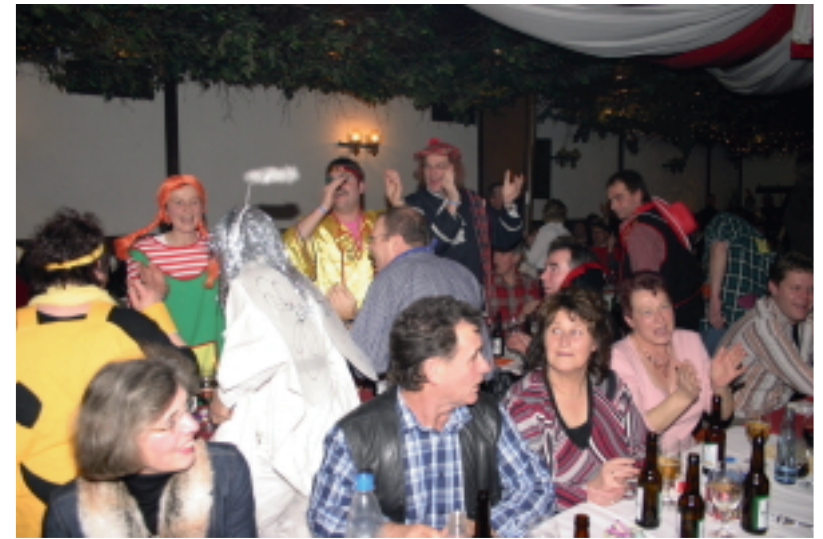
Kostümiert und voll gut drauf, so soll es sein. Bitte auch beim nächsten Mal.