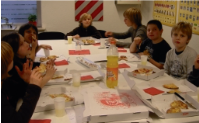
Zum Abschluss Pizza für alle zur Stärkung

►► rutschten oder nahmen ein Bälle-Bad. Zwischendurch fand ein Wettkampf um die Bälle zwischen den Mädchen und Jungen statt. Danach ging es zum Pizzaessen in die Fahrschule Bäume. Zum Abschluss bekamen alle zur Erinnerung an ihren Auftritt noch ein Foto. Der nächste Kinderkarneval findet am 21. Februar 2009 statt. Alle Kinder die Lust haben, sich daran zu beteiligen, sind herzlich eingeladen am 30. Januar 2009 um 16.00 Uhr in den Gasthof Antrup zu kommen. An diesem Nachmittag wählen wir das Kinderprinzenpaar, den Elferrat, sowie einen Zeremonienmeister. Wir freuen uns auch auf Kinder, die auftreten möchten als Tänzer, Büttendredner usw...■