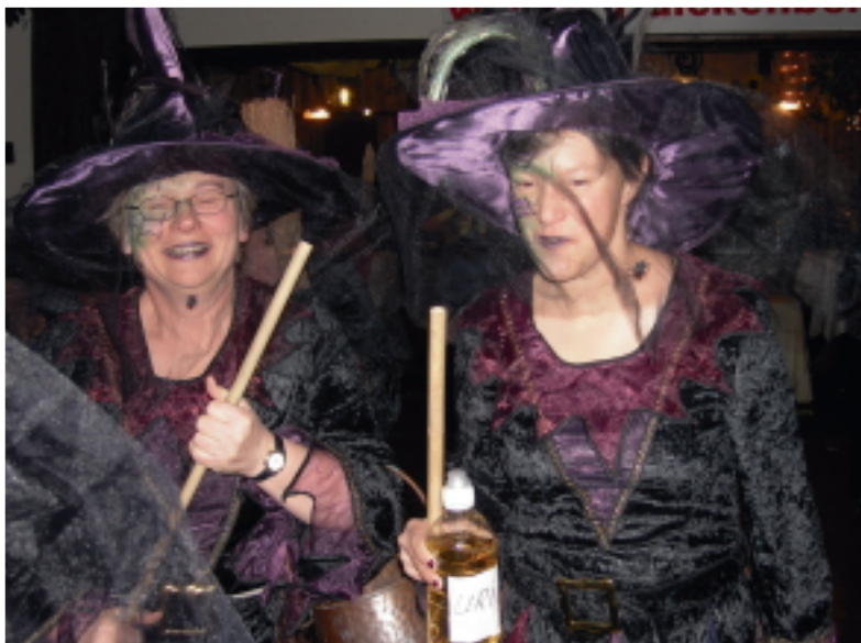
Der Frauen(hexen)-elferrat mit allerlei Arznei

▪Für die Feier, auf die sich alle 300 Frauen in Saal Antrup schon lange gefreut hatten, konnte pünktlich um 16.00 Uhr der Startschuss gegeben werden. Mit einem außergewöhnlichen Hexentanz eröffnete der Frauen(hexen)-Elferrat der Karnevalsgemeinschaft Dickenberg die diesjährige Weiberfastnacht.