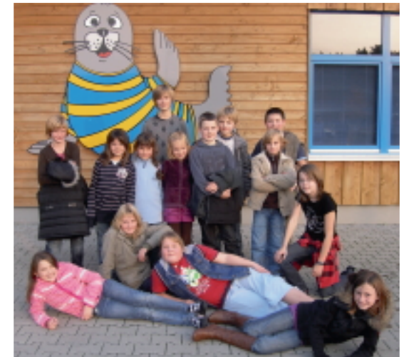
Alle Teilnehmer vom Kinderfest mit Robbie Robbe